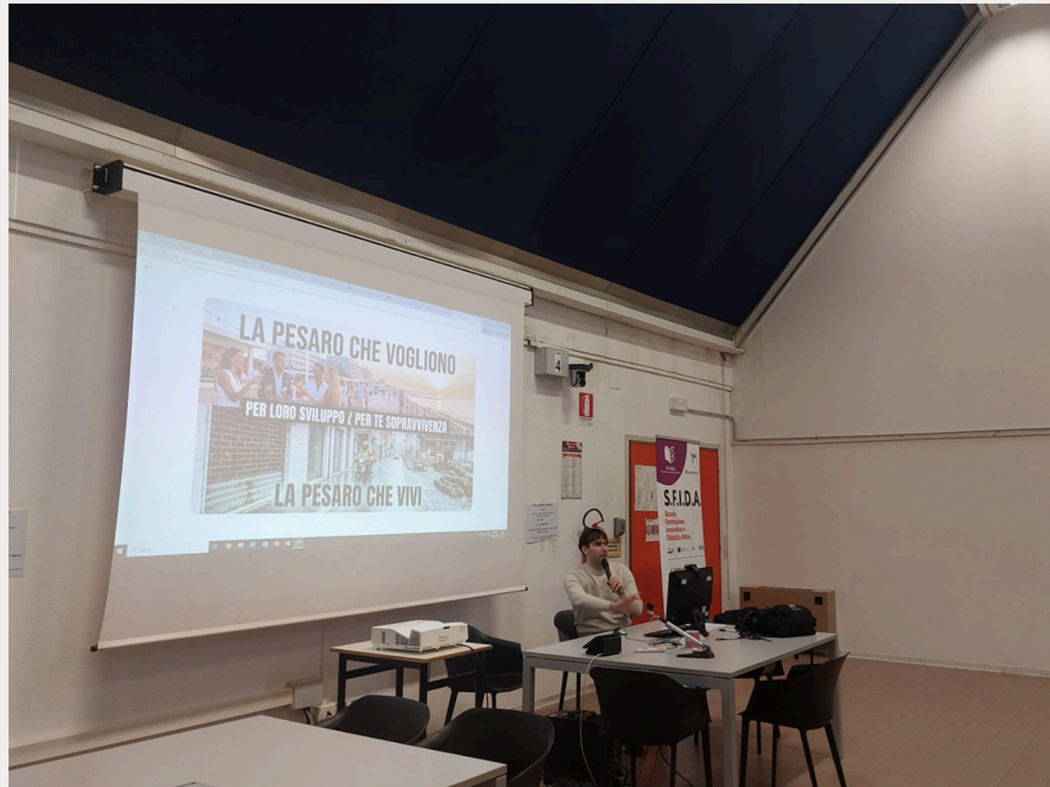
Lezione al Campus: esempio di persuasione mediatica costruita con AI