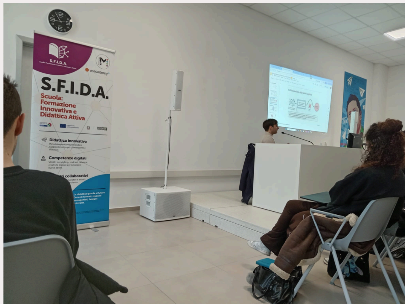
Lezione al Tagliolini